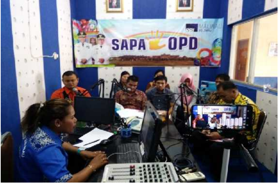
Peninjauan Sarana Fasilitas Kominfo