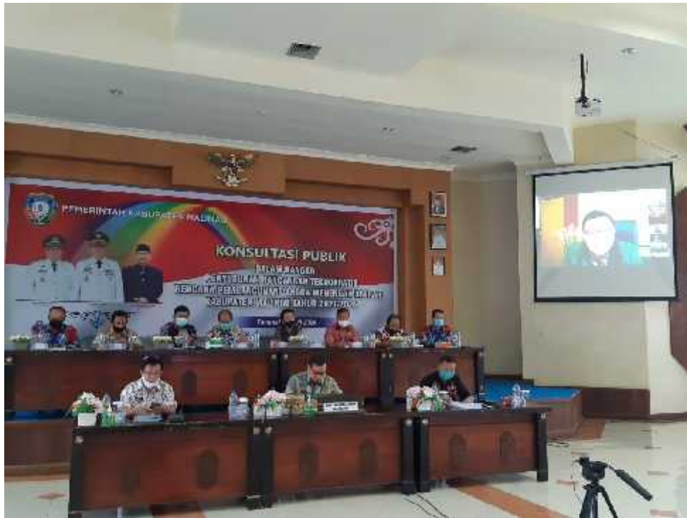
Virtual Meeting Musrenbang Kabupaten