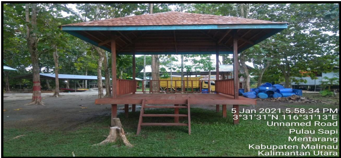
Dokumentasi Pembangunan Gazebo di Desa Wisata Pulau Sapi