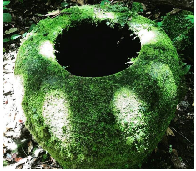
Dokumentasi Kuburan Batu Katembu dan Kuburan Batu Tua di Desa Long Berini Kec. Bahau Hulu