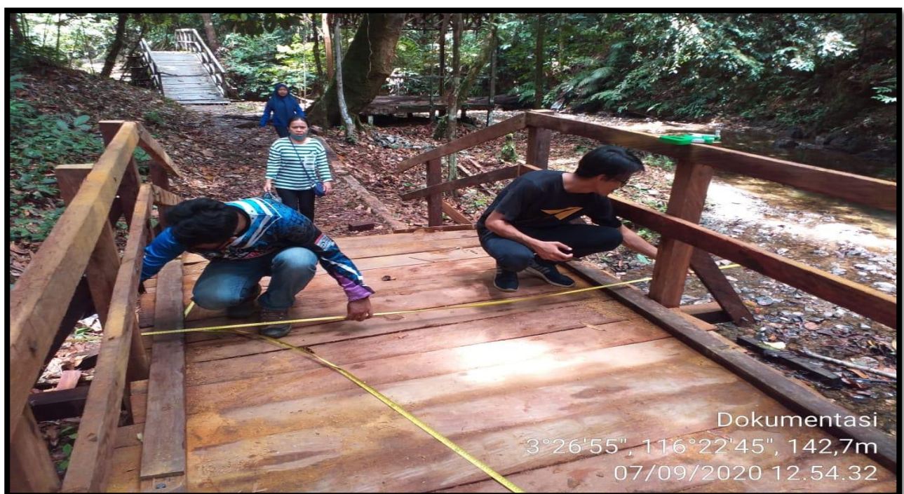
Dokumentasi kegiatan pembuatan Boardwalk di Objek Wisata Semolon

Dalam upaya mendukung terlaksananya program/kegiatan. Pada tahun 2020 Dinas Kebudayaan dan Pariwisata melaksanakan program Pengembangan Destinasi Wisata yang bertujuan pembangunan sarana dan pra sarana di Objek tujuan, dengan meningkatnya sarana dan pra sarana yang ada di objek wisata dapat memberikan kepuasan kepada wisatawan yang berkunjung dengan demikian juga akan memberikan dampak terhadap kunjungan wisatawan.