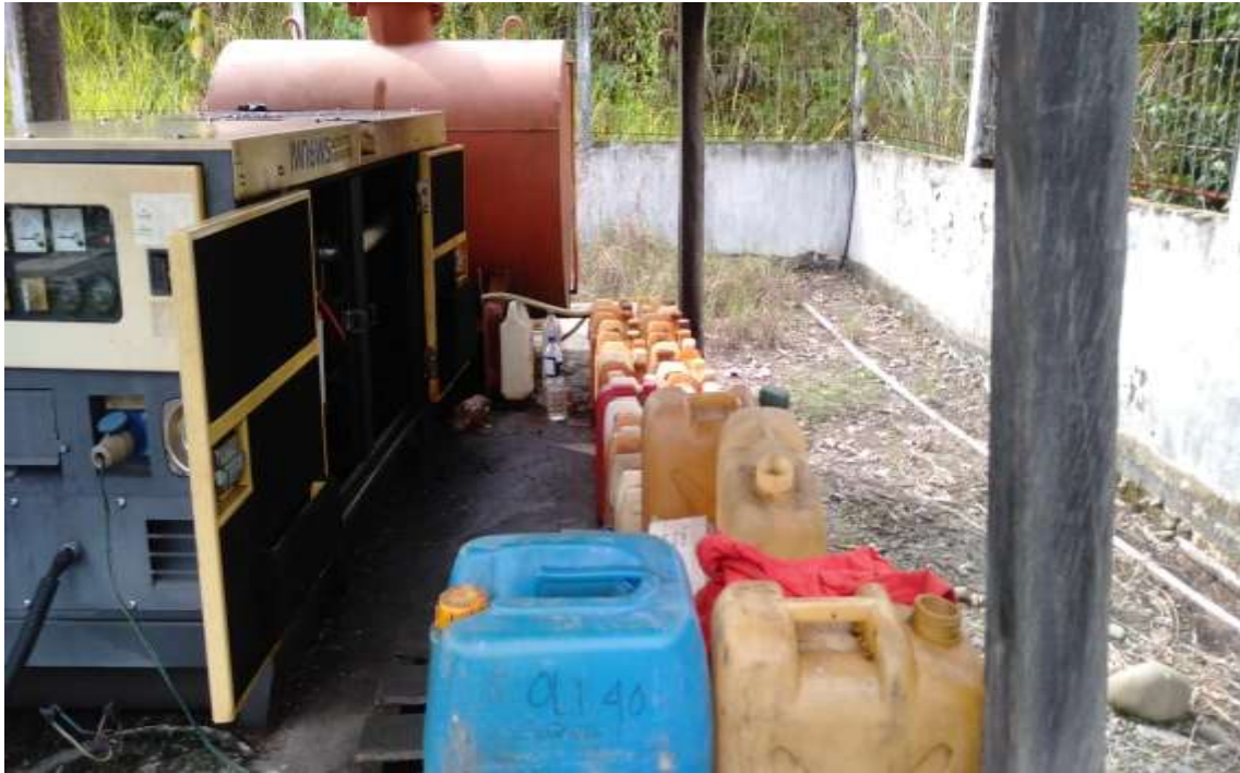
5.Site Long Nawang