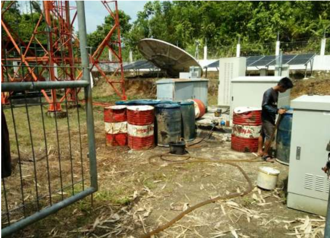
Pemeliharaan Catu Daya Tower Telekomunikasi :