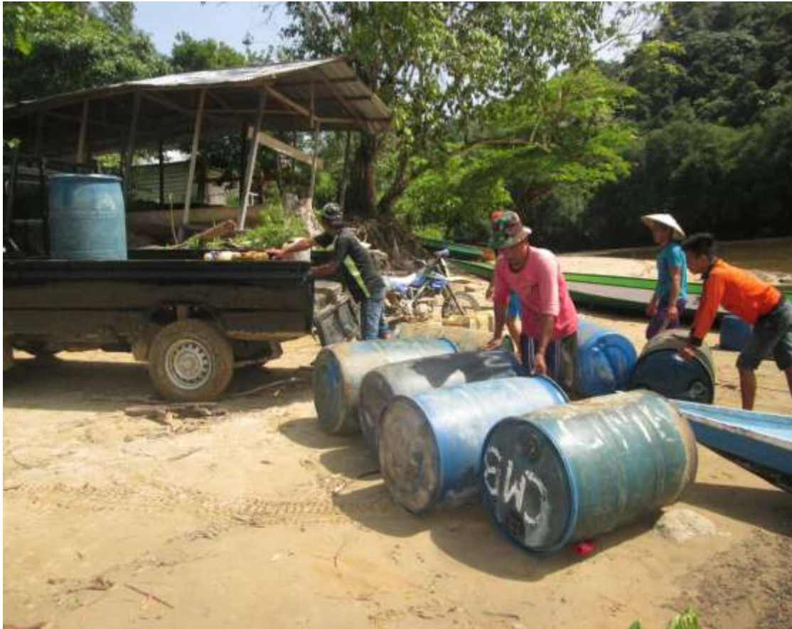
3.Site Long Ampung