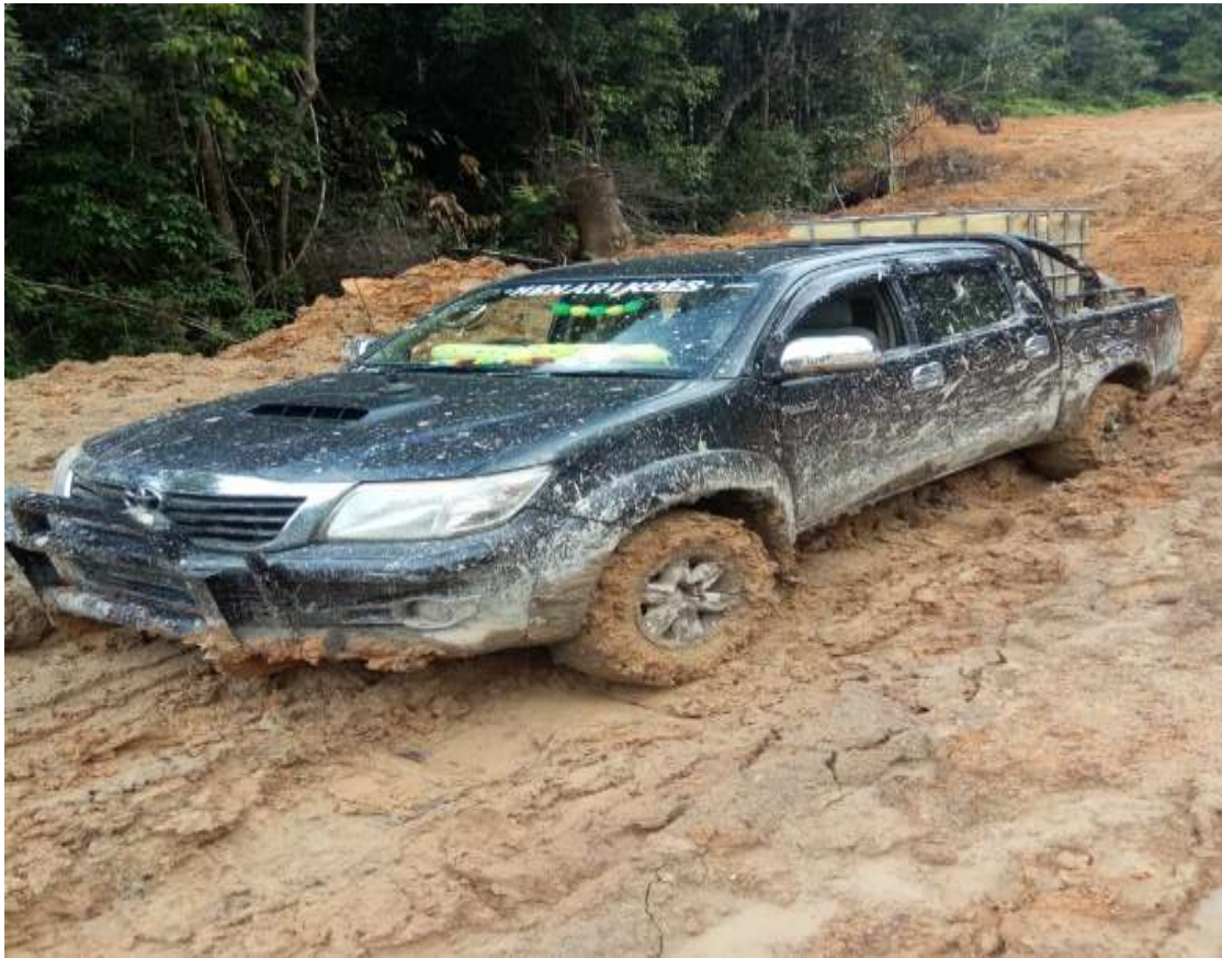
4.Site Long Berang