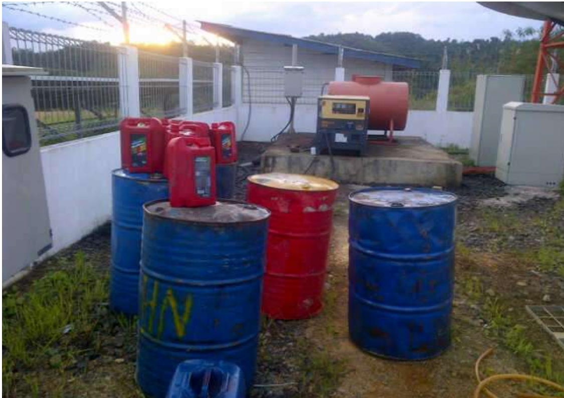
6.Site Long Sule